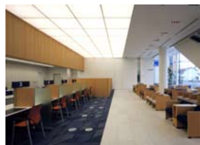
1階営業室客溜りロビー