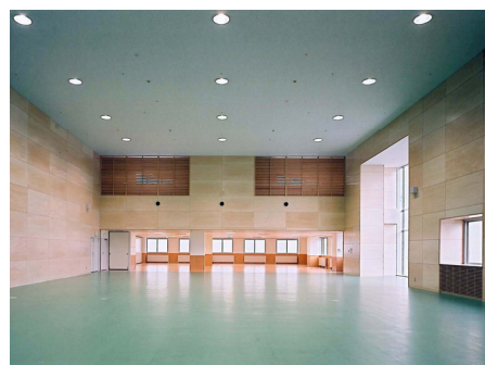
作業・生活療法室（体育館）